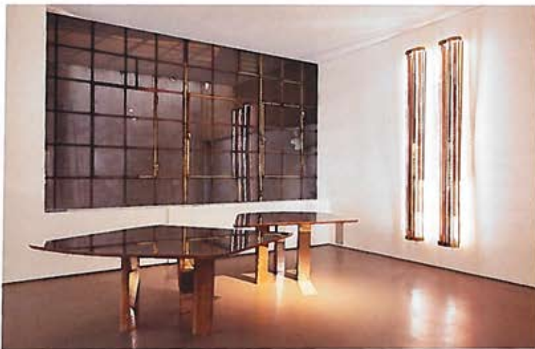
Tables et luminaires Tables and lamps Progetto Domestico DC1505 , VINCENZO DE COTIIS.