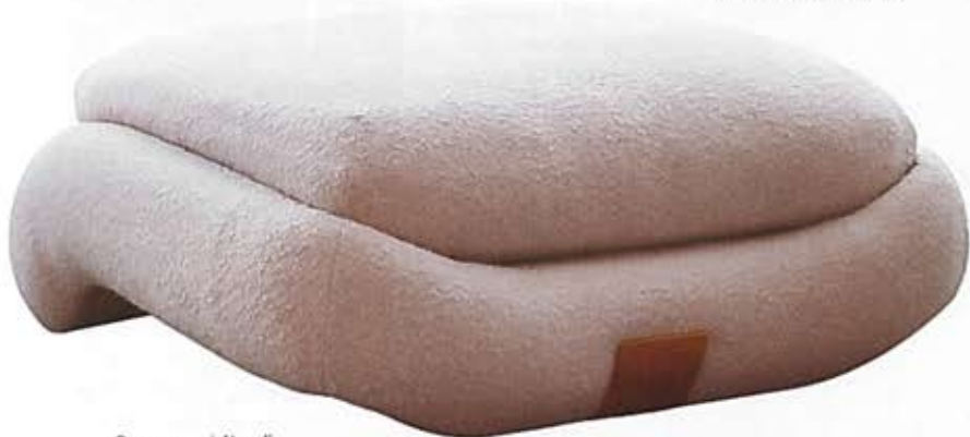
Ottoman | Pouf Progetto Domestico DC1512 , VINCENZO DE COTIIS.