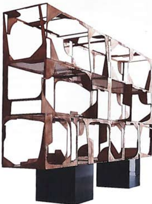
Bibliothèque | Bookcase Progetto Domestico DC1514 , VINCENZO DE COTIIS.